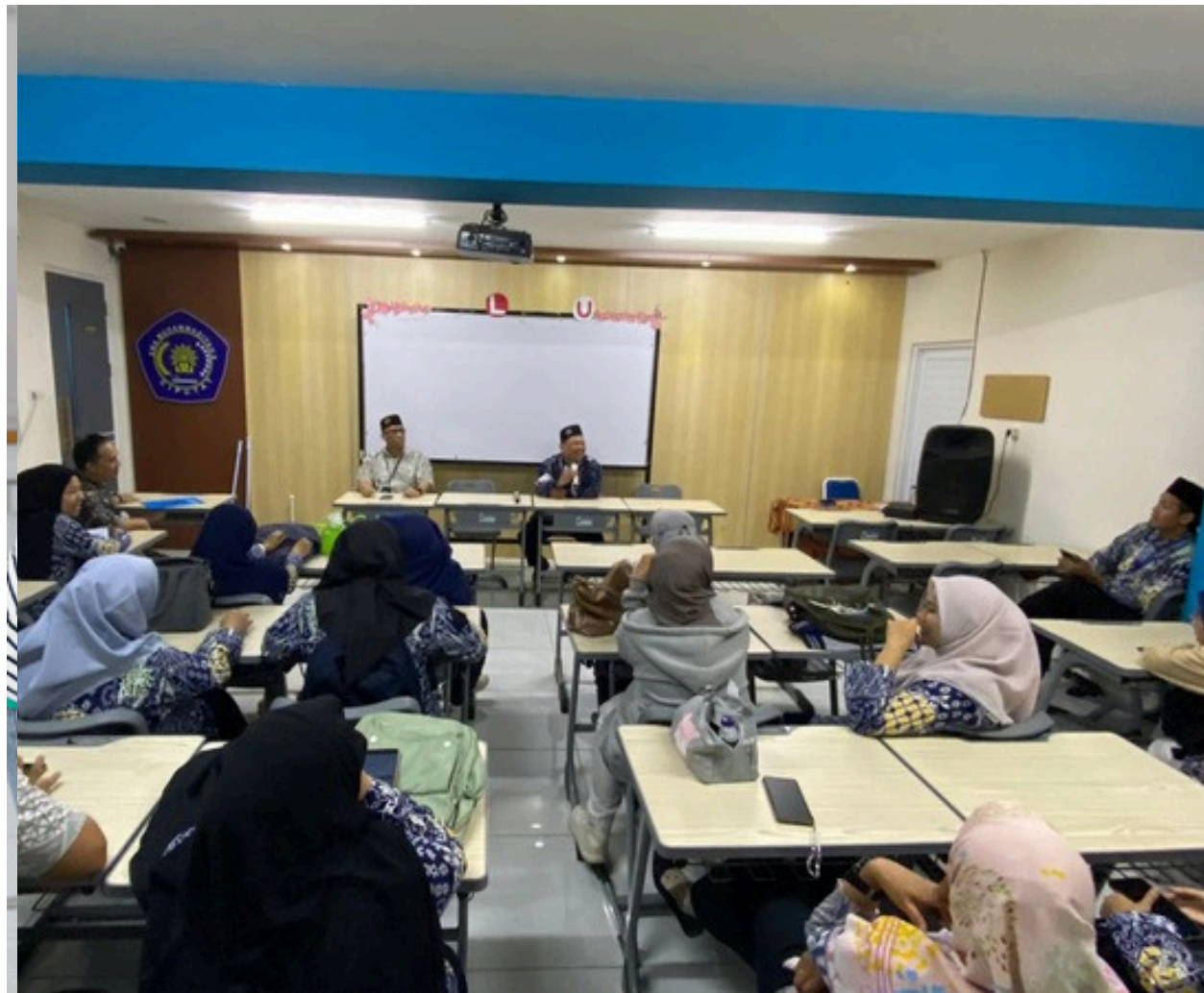
AULA / MEETING ROOM